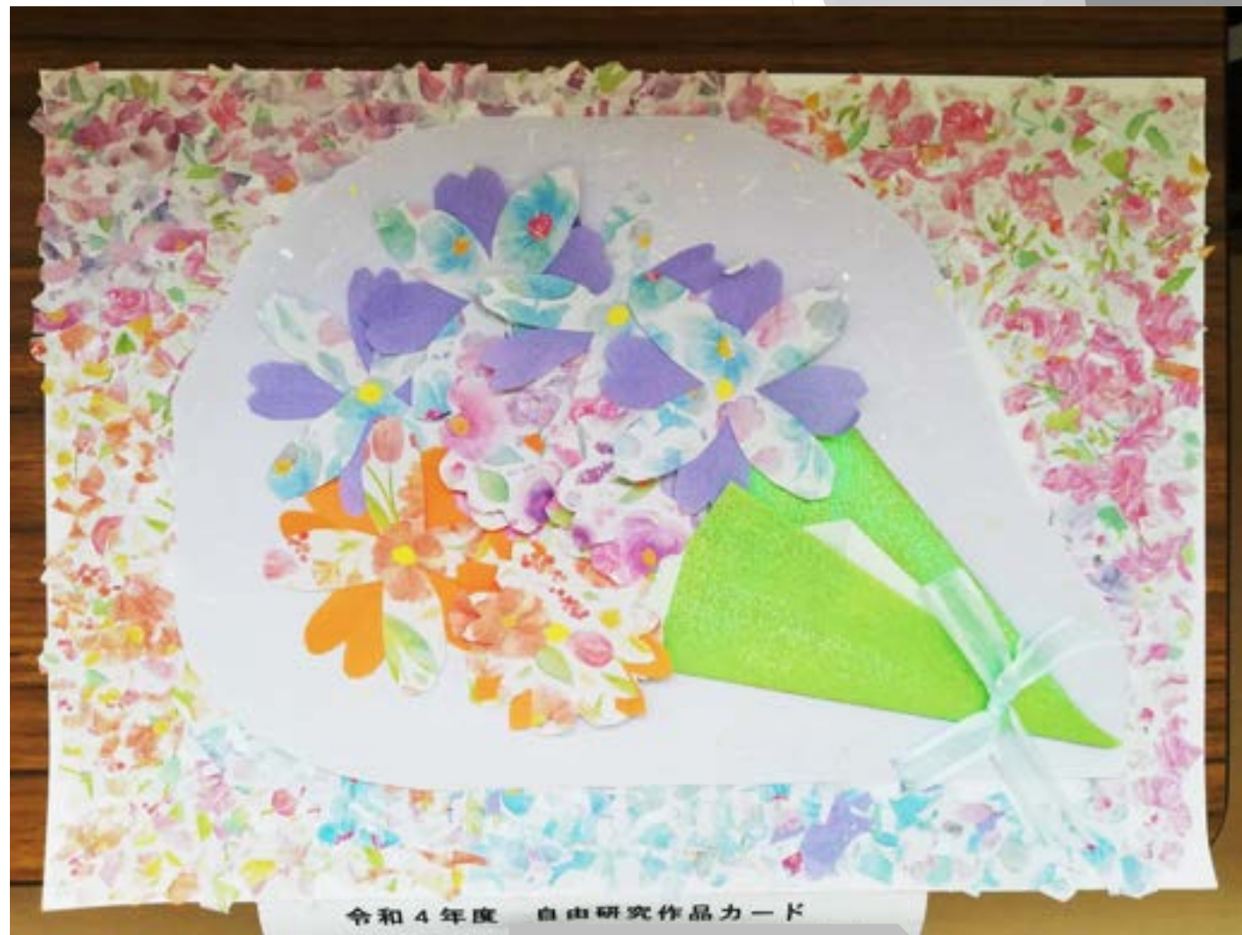
令和4年度 自由研究作品カード