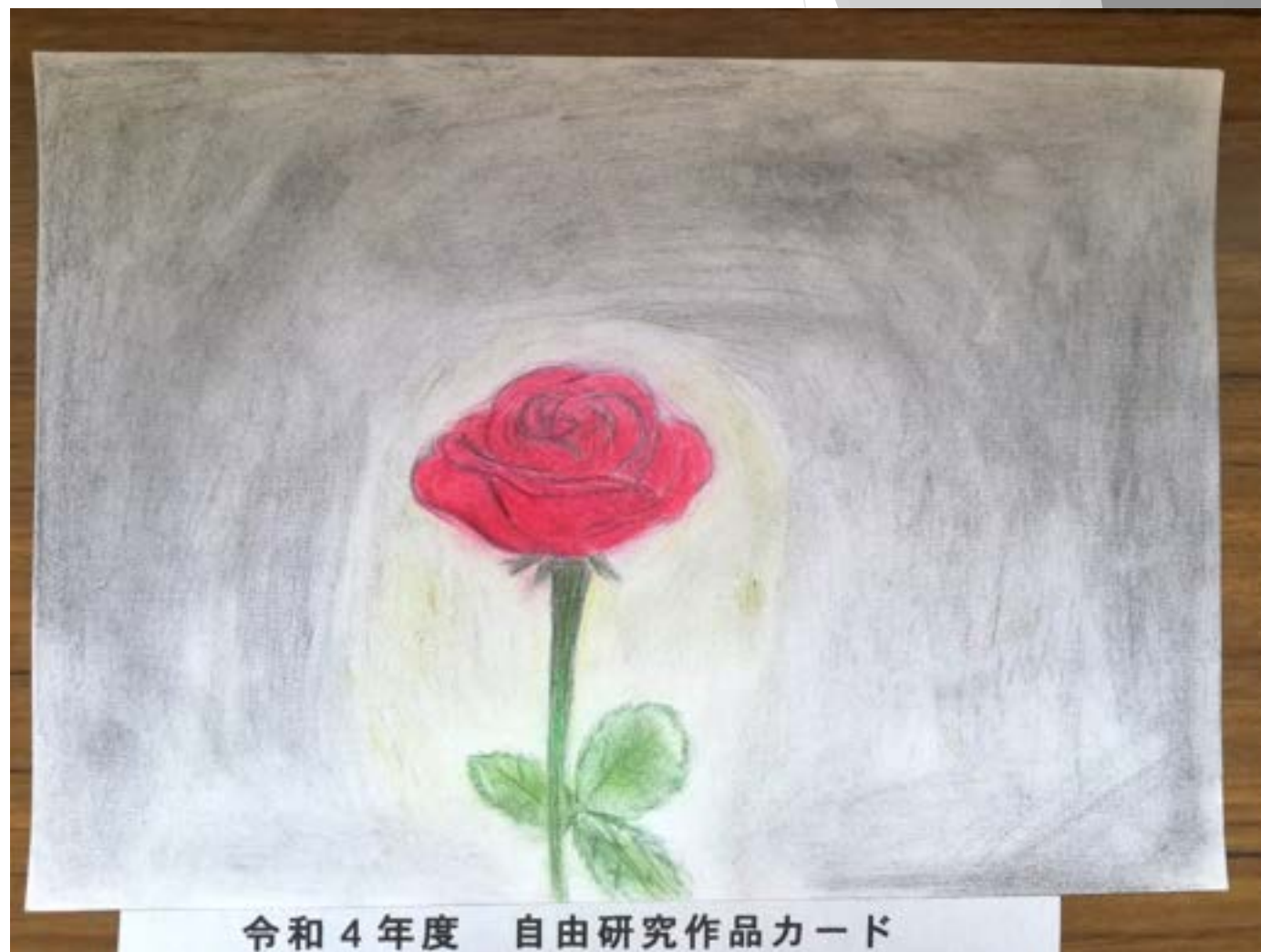
令和4年度 自由研究作品カード