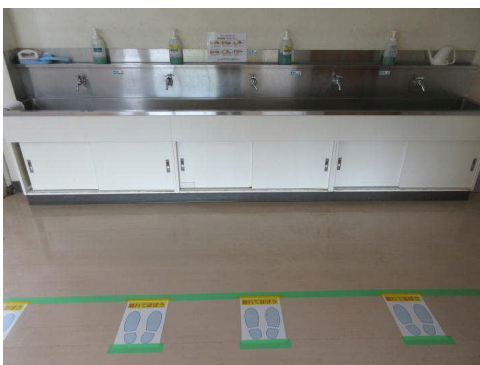
▲手洗いやうがいなどの徹底