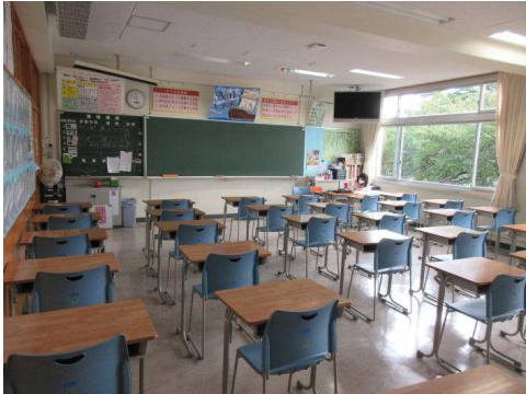
▲生徒のいない消毒済みの各教室で 学校再開に向けた準備をする教員