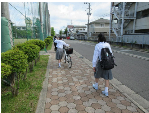
▲ソーシャルディスタンスに配慮した 登下校